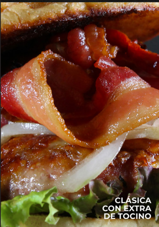
CLÁSICA CON EXTRA DE TOCINO